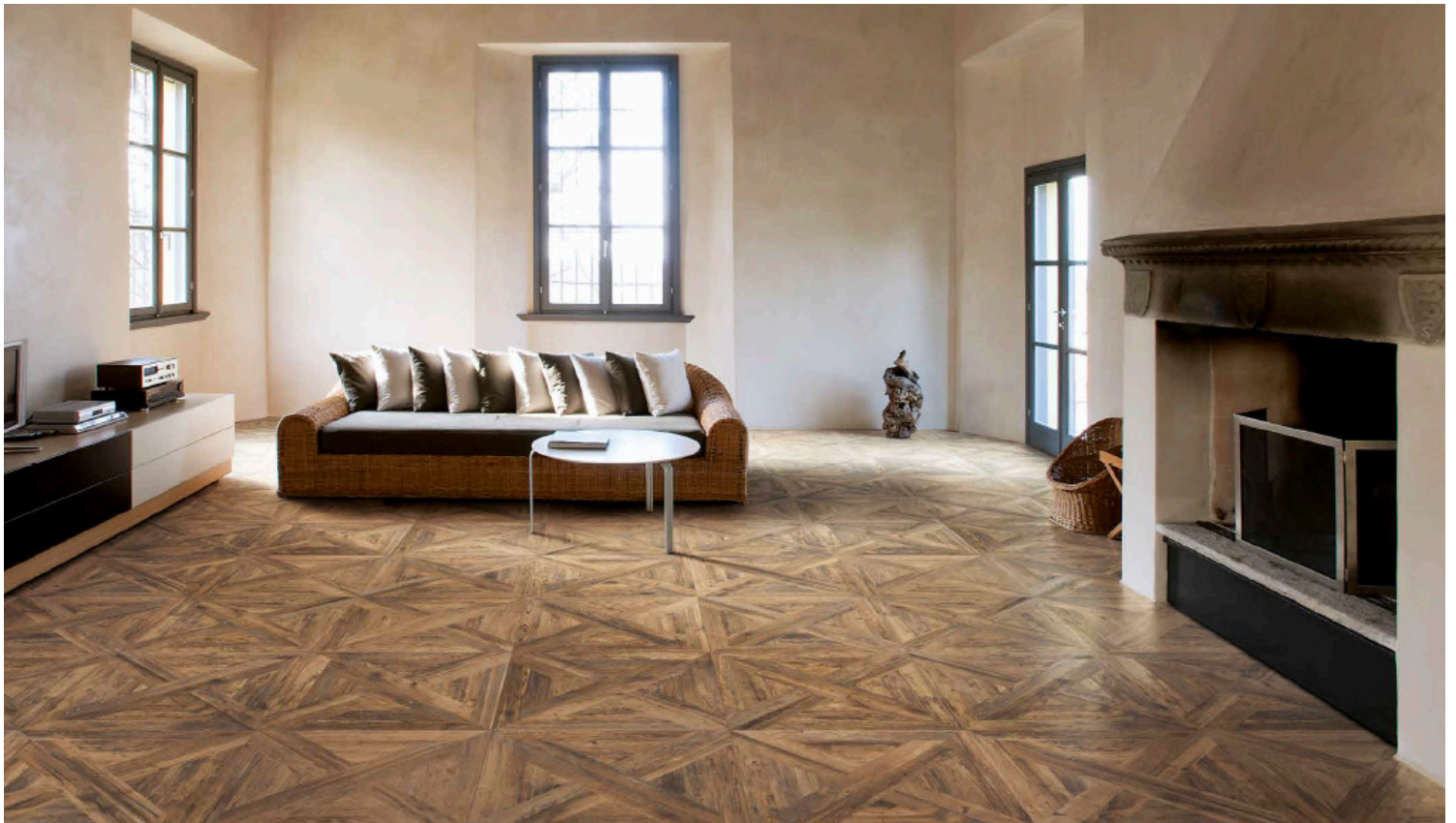
SUN (Beige foncé)